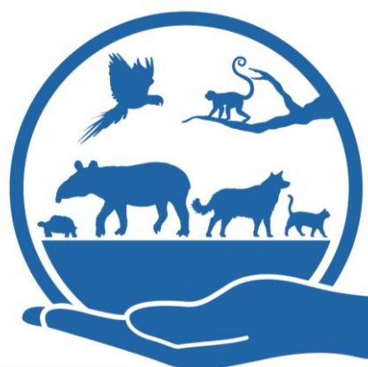
Imagen N°2. Ícono de la categoría Bienestar Animal