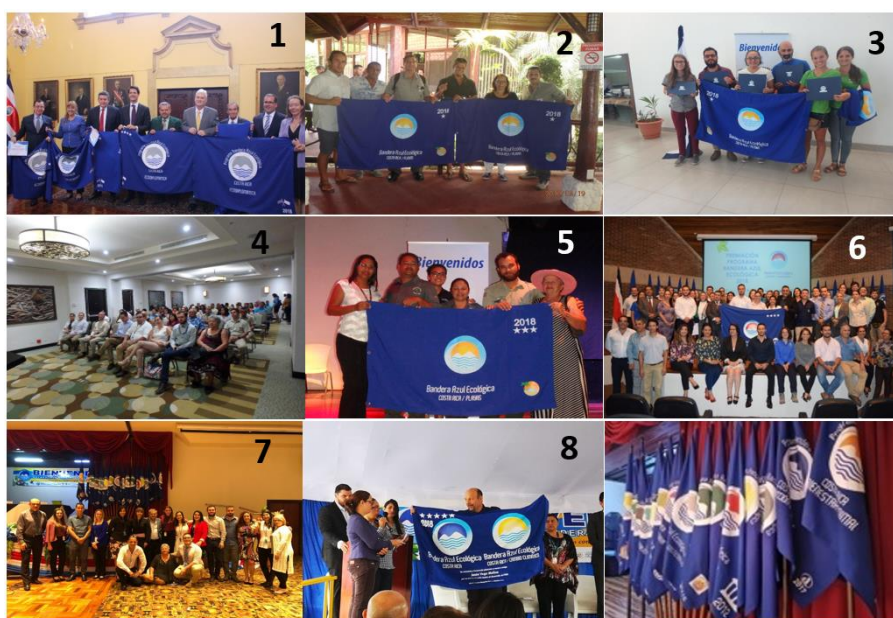
Imagen N°3. Comités Locales en los diferentes Eventos de Premiación Periodo 2018: 1. Ecodiplomática - Cancillería de Costa Rica / 2. Playas – Dominical / 3. Playas – Cóbano / 4. Playas – Liberia / 5. Playas – Limón / 6. Municipalidades – Auditorio CFIA / 7. Evento Nacional PBAE – San José Palacio / 8. Cambio Climático – ICE Sabana. Programa Bandera Azul Ecológica - 2019

Asimismo, el Acto Nacional de entrega de Galardones 2018 se llevó a cabo el 20 de junio en el San José Palacio.